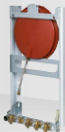
Bastidor de la caldera con vaso de expansión incluido.